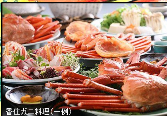
香住ガニ料理(一例)