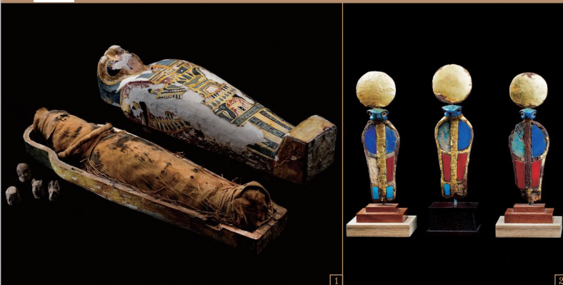
1. ホルスの4人の息子たちの護符とプタ・ハツカル・オシリス神のミイラ / 末期王朝～プトレマイオス朝時代 2. ウラエウス髪子装飾 / 新王国時代・第18王朝