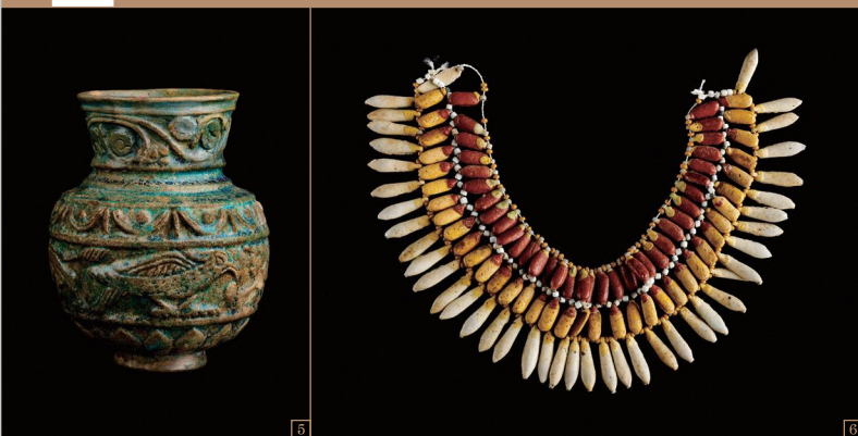
5. レリーフ装飾のある容器 / ローマ支配時代 6. 花をモチーフにした胸飾り / 新王国時代