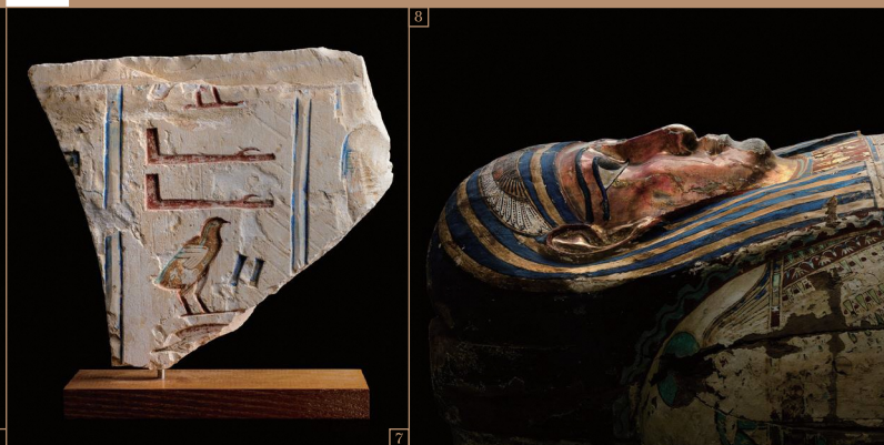
7. ヒエログリフが刻まれたレリーフ / 末期王朝時代 8. 人型木棺 / プトレマイオス朝時代初期