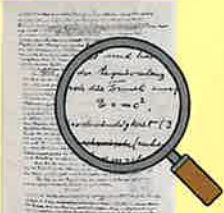
▲ 大家向けの科学雑誌に掲載された、 E=mc^2 の解説記事の直筆原稿(パネル)

アインシュタインもびっくり!? 予想できなかったすごい未来 そして彼の生涯を通じた平和への願い