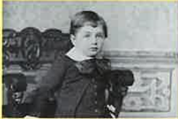
▲幼少時のアインシュタイン